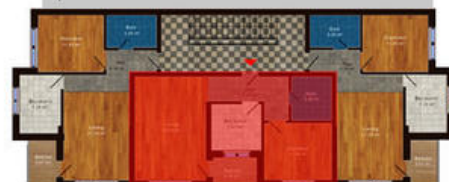
amplasament in imobil