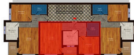
amplasament in imobil