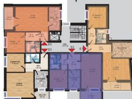
Amplasament apartament E2 etaj 1-3