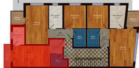
amplasament in imobil

Disponibil la etajele 1, 2, 3 Suprafata totala 35.75 m 2