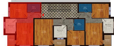
amplasament in imobil

Disponibil la etajele 1, 2, 3 Suprafata totala 53.00 m 2