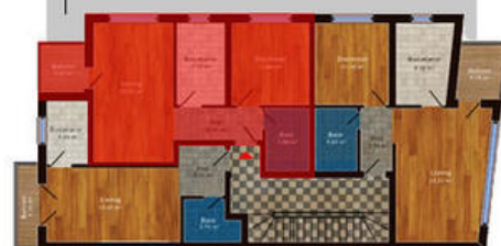
amplasament in imobil

Disponibil la etajele 1, 2, 3 Suprafata totala 54.00 m 2