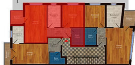
amplasament in imobil

Disponibil la etajele 1, 2, 3 Suprafata totala 54.00 m 2