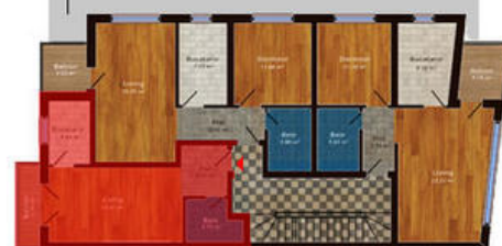
amplasament in imobil

Disponibil la etajele 1, 2, 3 Suprafata totala 35.75 m 2