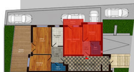
amplasament in imobil