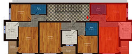
amplasament in imobil